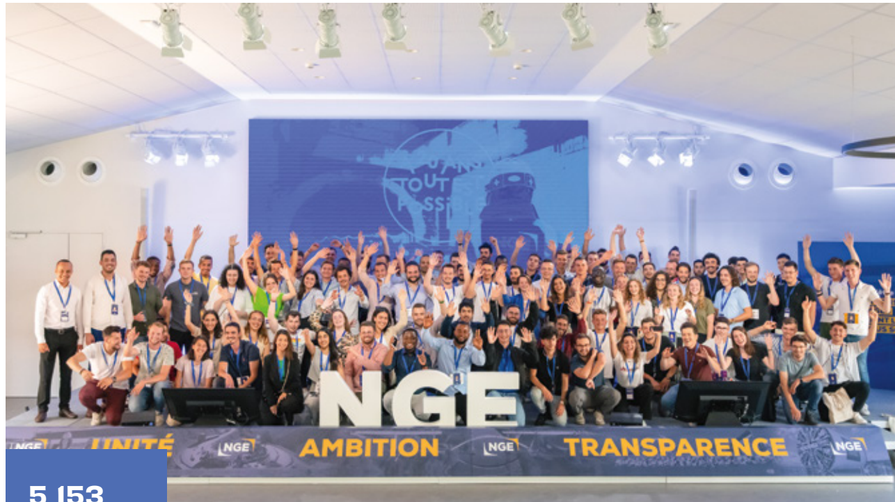
▼ Journée découverte pour les stagiaires en projet de fin d'études

Face à la pénurie de main-d'œuvre, la guerre des talents et l'émergence d'un nouveau rapport au travail, NGE se réinvente.