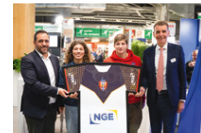
▼ Signature le 22 novembre 2022 du partenariat avec le club Blagnac rugby féminin

Impliqué depuis toujours dans l'insertion et l'inclusion professionnelles, NGE collabore avec les acteurs locaux de l'emploi, dont Pôle emploi. Depuis 2022, il bénéficie de l'expertise d'une conseillère entreprise référente qui travaille au sein même des équipes RH, véritable porte d'entrée des services de Pôle emploi pour l'ensemble du Groupe.