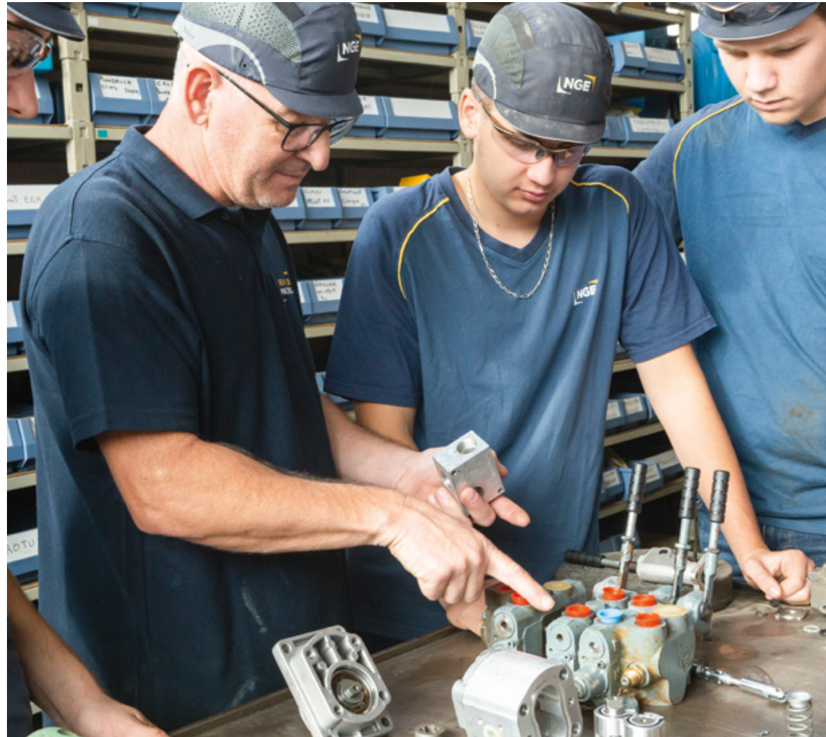
▼ Formation d'alternants dans l'atelier mécanique

Cultiver le lien qui unit les collaborateurs, la solidarité, le partage, la convivialité est LA condition pour faire en sorte que chaque collaborateur de NGE se sente partie prenante dans l'aventure collective de NGE. Avec en moyenne 4 000 personnes recrutées par an, NGE veille à la préservation et à la transmission de sa culture d'entreprise et de ses valeurs, points essentiels pour lesquels les tuteurs du Groupe sont précieux. Les journées découvertes, points d'orgue dans un parcours, y contribuent et le Groupe tient à ce que chacun – encadrant, etam, ouvrier – puisse y participer. En 2022, les journées découverte ont été déployées dans toutes les entités en France et, fait nouveau, deux sessions ont eu lieu à Casablanca et à Londres. Autre point essentiel dans la transmission des valeurs, l'actionariat salarié qui nourrit l'ambition, l'audace, l'envie d'entreprendre. Devenir actionnaire, c'est participer pleinement au destin de NGE et partager les fruits de la croissance. En 2022, le Groupe a lancé sa 7 e opération en France.