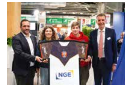
▼ Firma de la colaboración con el Blagnac Rugby Club el 22 de noviembre de 2022

NGE siempre se involucra en la integración profesional y la inclusión, y colabora con agencias de empleo locales, como Pôle emploi. Desde 2022, NGE cuenta con la experiencia de un asesor corporativo que trabaja en los equipos de RR. HH., la puerta de entrada a los servicios de Pôle emploi para todo el Grupo.