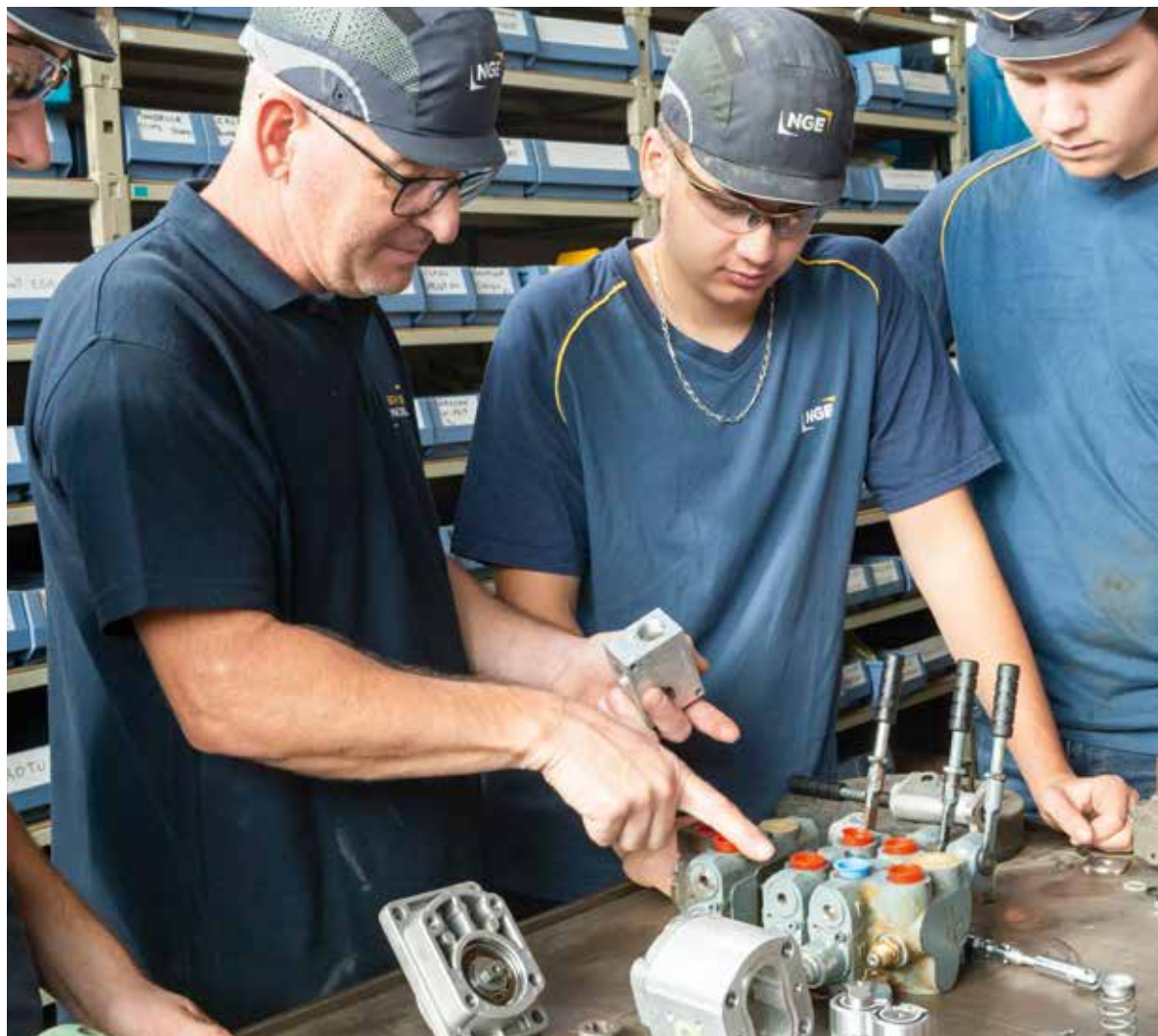
▼ Capacitación de aprendices en alternancia en el taller mecánico

Fomentar los vínculos de unión entre los empleados, la solidaridad, el intercambio y la convivencia es LA condición para que cada empleado de NGE se sienta parte de su aventura colectiva. Con un promedio de 4,000 contrataciones al año, NGE se esfuerza por preservar y transmitir su cultura y sus valores de empresa, puntos esenciales para los cuales los tutores del Grupo resultan muy valiosos. Las Jornadas de Descubrimiento constituyen puntos clave en una trayectoria profesional y el Grupo desea que todos, tanto supervisores, como técnicos y albañiles, puedan participar. En 2022, se organizaron Jornadas de Descubrimiento en todas las entidades de Francia y, como novedad, se celebraron dos sesiones en Casablanca y Londres. La participación accionaria de los empleados es otro punto esencial en la transmisión de valores, ya que estimula la ambición, la audacia y las ganas de emprender. Convertirse en accionista significa participar plenamente en el destino de NGE y compartir los frutos de su crecimiento. En 2022, el Grupo puso en marcha su séptima campaña en Francia.