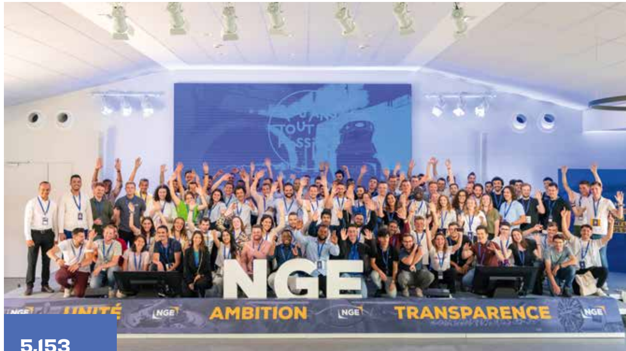
▼ Jornada de Descubrimiento para estudiantes con proyectos de fin de carrera

Ante la escasez de mano de obra, la guerra por el talento y el advenimiento de una nueva relación con el trabajo, NGE decidió reinventarse.